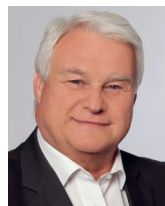
Roland Keller Basler&Hofmann AG