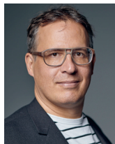
Demian Rudaz RUDAZ ARCHITEKTEN GmbH