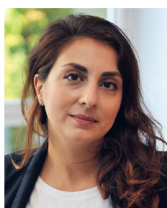
Golrang Daneshgar Stadt Wädenswil Werke